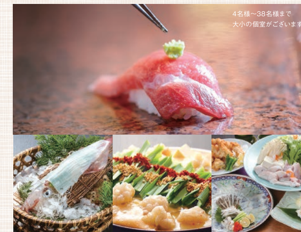
4名様～38名様まで 大小の個室がございます